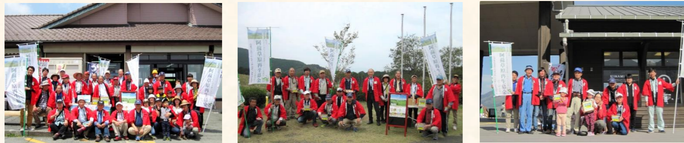
協議会構成員が集まり、年に数回、阿蘇地域の観光施設等で募金キャンペーンを実施しています。※2020年以降はコロナ禍により、街頭キャンペーンが実施出来ていません。