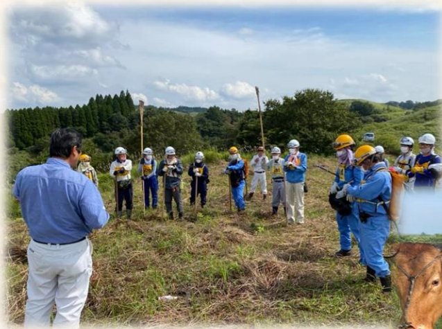
野焼き支援ボランティア活動