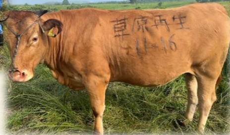
繁殖あか牛の導入助成