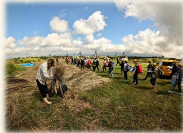
草原環境学習等の支援