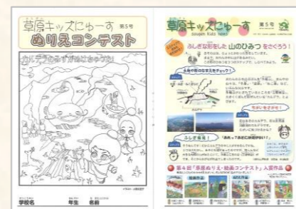
草原キッズにゆーすの発行や子ども地域学習発表会など