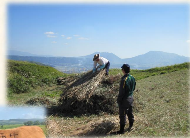
草小積み再生プロジェクト